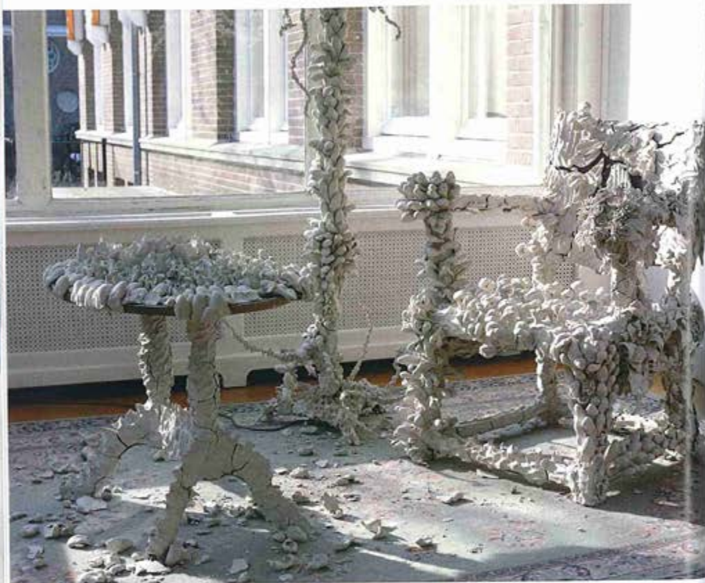
Poëzie in klei - riëlle beekmans

Ik zag jouw werk 'Poëzie in klei.' Je maakte hier meubels mooier met klei. Werk je altijd op deze manier?